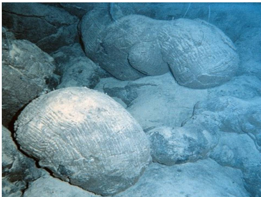
Рис. 2. Подушечные базальты (пиллоу-лавы), излившиеся в рифтовой долине Срединно-Атлантического хребта.

Исследование выполнено за счет гранта Российского научного фонда № 22-27-00815, https://rscf.ru/project/22-27-00815/